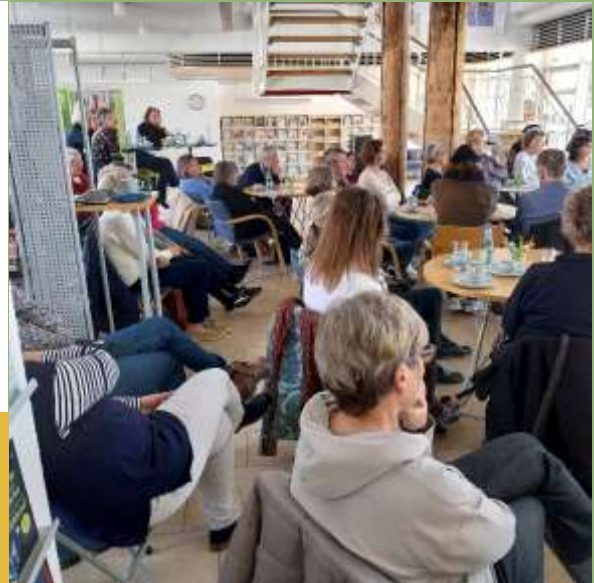
Matinee am 8.3.25