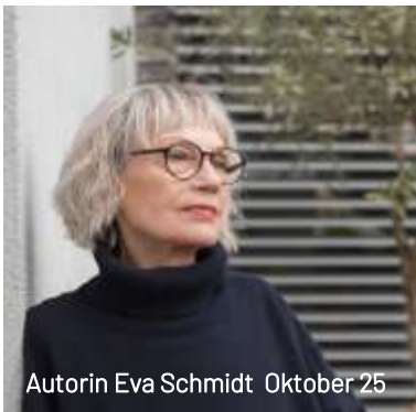
Autorin Eva Schmidt Oktober 25