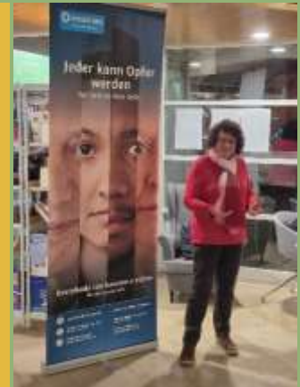
Orange Day im Dezember 25