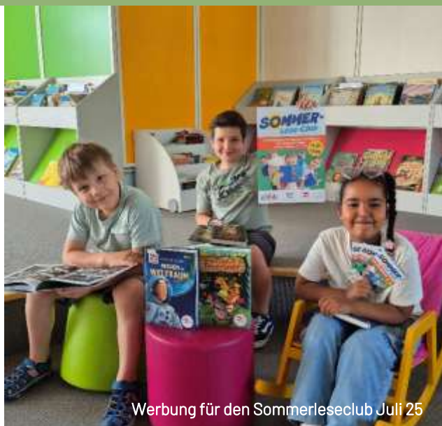
Werbung für den Sommerleseclub Juli 25

Die Kinderbibliothek ist mit der Tettninger Bildungsszene eng vernetzt und arbeitet mit allen Schulen sowie Kindergärten kontinuierlich zusammen. Sie bemüht sich aktiv um leseferne Kinder. Aber auch für Familien, die Wert auf die Bildung legen, ist die Kinderbibliothek unverzichtbar und ein positiver Standortfaktor. Alle Veranstaltungen sind regelmäßig ausverkauft.