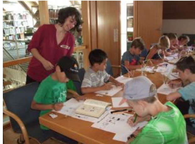
Volles Haus beim Comiczeichnenworkshop in den Sommerferien

Sei es das Kindertheater in den Osterferien, der Greg-Zeichenworkshop im Sommer oder seien es diverse Besuche von Ferienbetreuungsgruppen: In den Ferien steigt der Bedarf nach Angeboten. Öffnungszeiten während aller Ferien sind unerlässlich. Schon immer deckte die Stadtbücherei fast die gesamten Schulferien mit Öffnungszeiten ab. Im Jahr 2016 galt dies erstmals auch für die gesamten Weihnachtsferien.