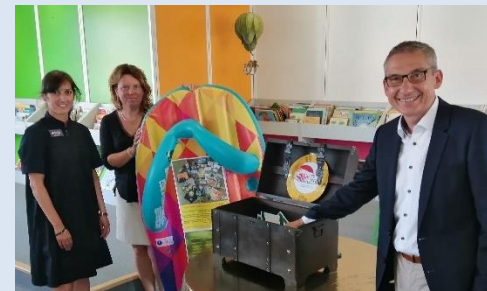
Verlosung Heiß auf Lesen im September 20