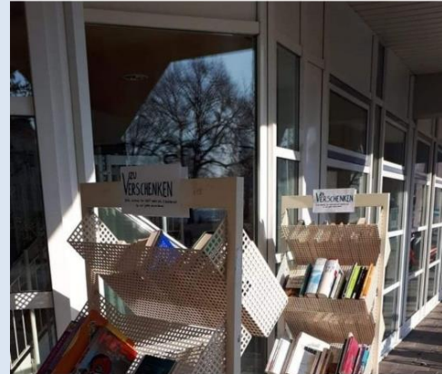
Facebook-Eintrag März 2020

Gerade an der Stadtbücherei gesehen. Bücher zu verschenken.