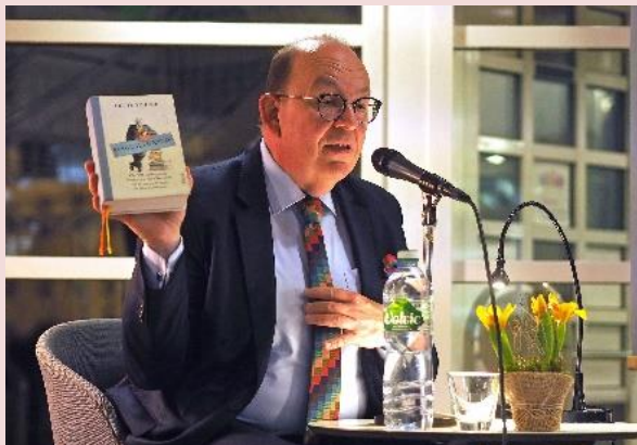
Denis Scheck am Mo, 10. 2. 2020