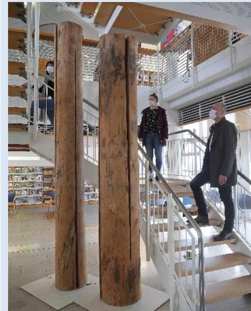
Skulptur von Rudolf Wachter